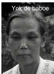
Yok de baboe